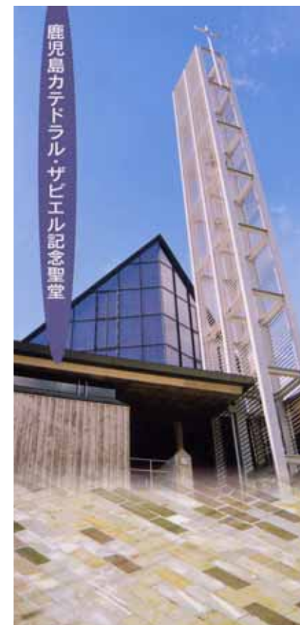
鹿児島カテドラル・ザビエル記念聖堂

http://xavier-kagoshima.net/ 電話 099 (222) 3408 FAX 099 (224) 6156 〒892-0841鹿児島市照国町13-42